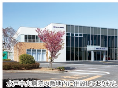
水戸中央病院の敷地内に併設しております。